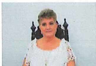
Integrante Dip. Rita del Carmen Galvez Bonora