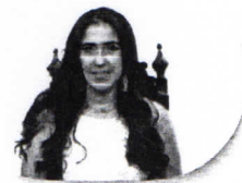
Diputada Norma Araceli Aranguren Rosique