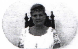
Diputada Rita Del Carmen Galvez Bonora